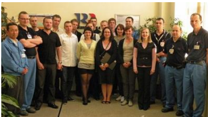
Uczestnicy warsztatów.

Studenci krakowskiej AGH uczą się zarządzania od Japończyków z Wolbromia.